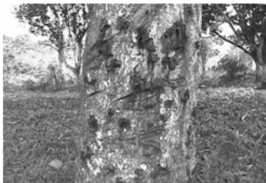
Árbol de mangos de la escuela de Belén de los Andaquies.