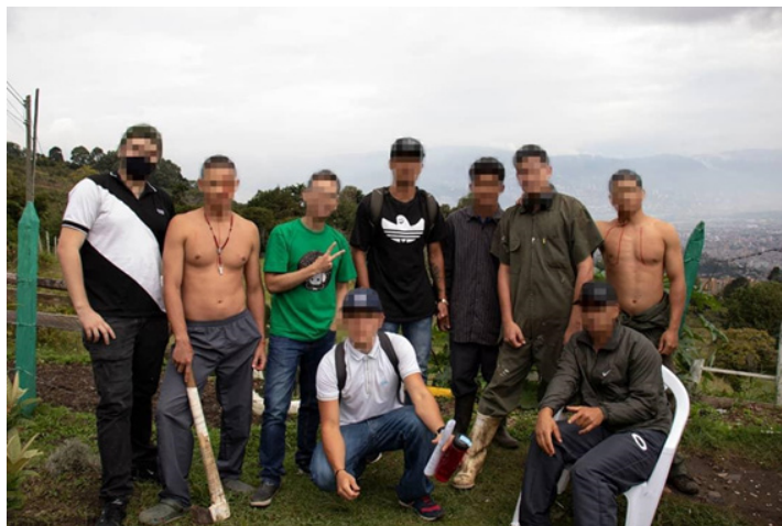
Clase de dramaturgia y dirección teatral con excombatientes AUC - Cárcel de Menores de Antioquia. 2020

La escritura fabulada no es una tierra donde siempre se echa raíz, es en cambio, un abrazo pasajero, un balcón del desahogo, una temporada de quirófano gramático donde se socorre al espíritu y se retorna al mundo para seguir andando en letras.